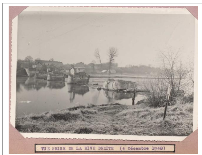
AD37/2009W - décembre 1940

Or le pont de Chandon a été détruit par l'armée française en juin 1940 :