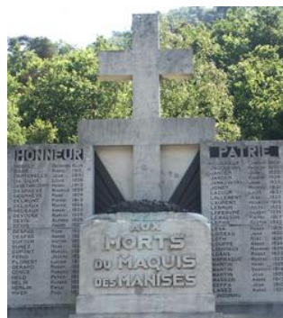
Le Monument du Maquis des Manises.